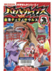
平山廉/監修 (朝日新聞出版)

防衛組織「バトル・ブレイブス」の使命は敵Zが送り込んでくる生物を捕獲しもとの世界に返すこと。東京で恐竜が大暴れ!? 隊員たちが捕獲作戦を開始する！