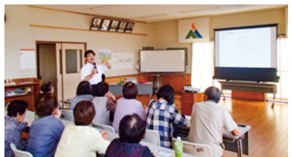
認知症をテーマにした出前講座の様子