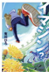
有川ひろ/著 (幻冬舎)

憧れていた映像制作の現場に飛び込んだ良井良助。慣れない現場であたふたする良助だったが、作品と向き合う仲間たちの熱気に焦られるような思いを募らせ…。