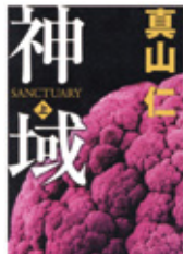
真山仁／著 (毎日新聞出版)

脳細胞を蘇らせる人工万能幹細胞が誕生。日本政府は一刻も早い実用化を迫る。しかし、本当に再生細胞は安全なのだろうか…。バイオ・ビジネスの光と闇を描く医療サスペンス。