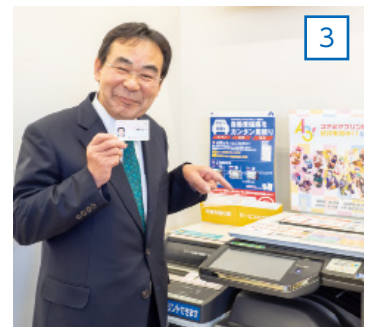
マイナンバーカードを 使って操作開始!