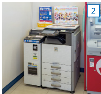
証明書を交付する マルチコピー機