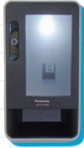
▷顔認証付きカードリーダー

当院では、令和3年10月20日に本格運用が開始された「オンライン資格確認」システムを導入し、マイナンバーカードを健康保険証として利用できる体制を整備しました。