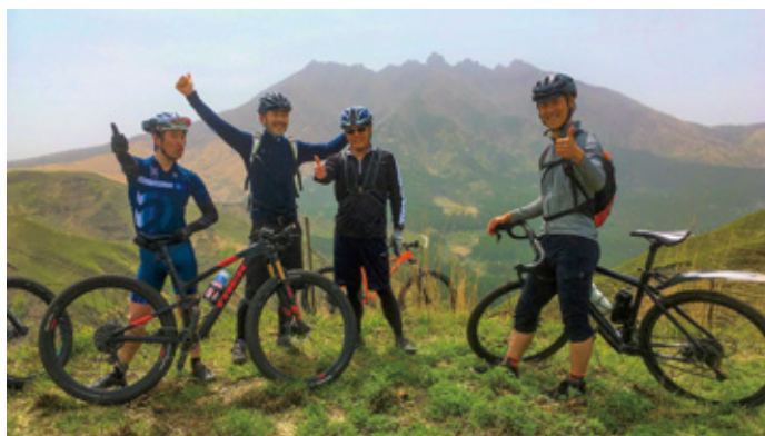
草原ライドのようす

阿蘇の草原ライドは究極の大人の遊び。なだらかな草原や起伏に富んだ草原に加え、落ち葉のじゅうたんに浮石や陥没区間などさまざまな地形をクリアしていく走行感を体験することが出来ます。この受賞をきっかけに日本全国から、また、コロナウィルスが収束した暁には国境を越えて世界中から阿蘇の地へと足を運んでいただき、一人でも多くの人に阿蘇のファンになってもらえることを願っています。