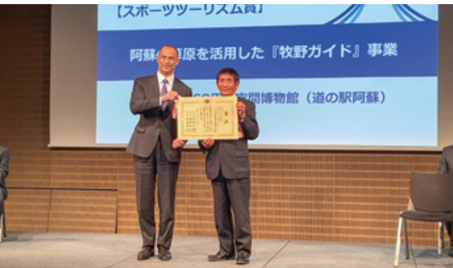
室伏広治スポーツ庁長官（左）と山本理事長（右）