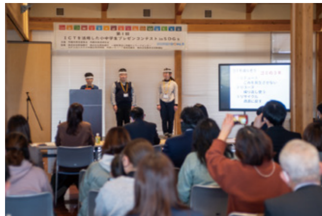
▲発表する児童たち

2月4日、阿蘇草原保全活動センターで、阿蘇市内の小中学生が身近な「持続可能な開発目標 (SDGs)」について考えたことを発表するコンテストが開かれました。取材や発表には ICT (情報通信) 技術を活用。SDGs について学んだことを、それぞれ工夫を凝らした手作りのスライドで示しながら来場者に伝えました。