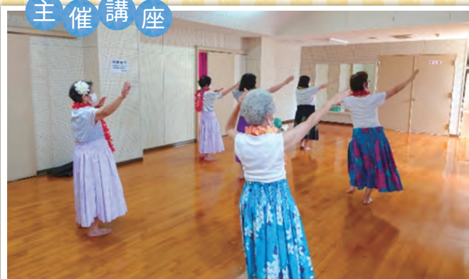
マナフラ(初級)& ボディセラピーの様子