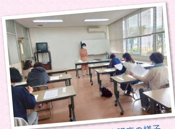
くらしに役立つ美文字講座の様子