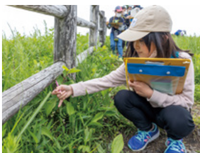
▲スズランを観察する児童

5月25日、波野小の児童36人が、スズラン自生地でスズランやシライトソウなどさまざまな種類の植物を観察しました。