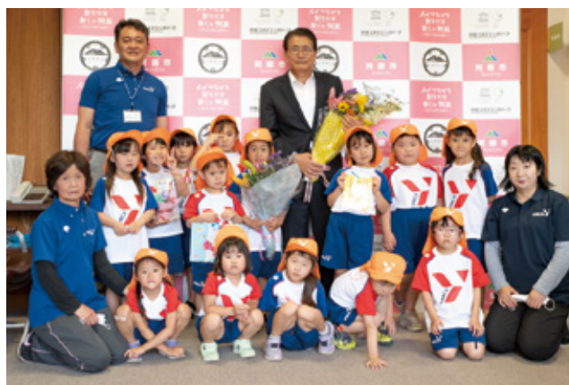
▲花束を贈った園児たち

6月第2日曜の「花の日」にあわせて熊本YMCA尾ヶ石保育園の年長児9人と年中児5人が、6月7日、市役所を訪れました。