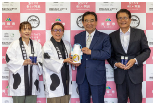
▲父の日に合わせて牛乳が贈られた

6月5日、大阿蘇酪農業協同組合女性部が父の日に合わせて市役所を訪れ、佐藤市長に牛乳を贈りました。