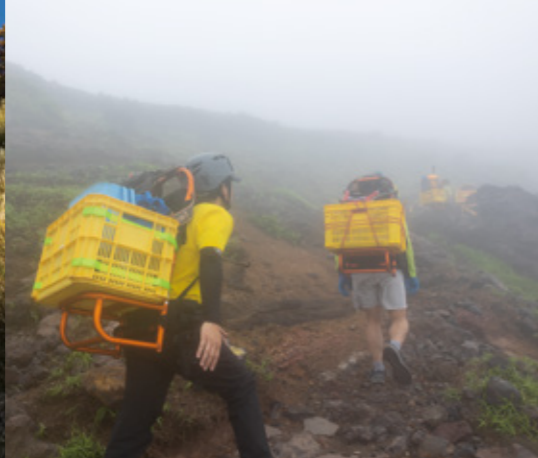
登山道整備では大量の石を運ぶため、大変な作業になる。