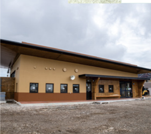
新たに整備された二次避難休憩施設