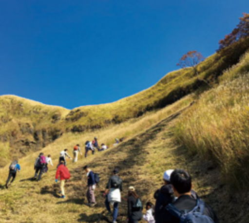
子どもたちと山に登る