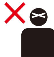
컨디션이 좋지 않은 분