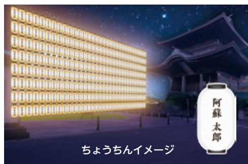
ちょうちんイメージ