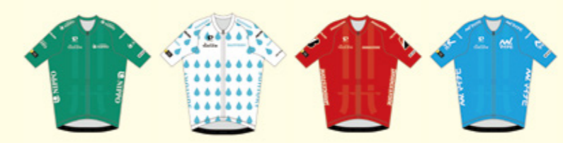
ヤングライダー賞 山岳賞 ポイント賞 個人総合時間賞

スプリントポイントや山岳ポイントなどのポイントが最も高い選手は各ステージで特別なジャージを着用して走ります。中でも、個人総合時間賞は各ステージの個人タイムの合計が最も早い選手に与えられる最も賞賛される賞です。