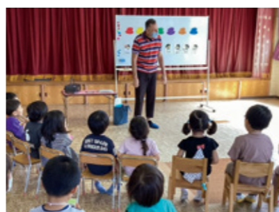
▲ 教室での園児たち