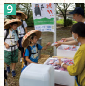
5 8月15日の波野高原納涼まつり。バルーンを貰いました。 6 屋台の食べ物もまつりの楽しみのひとつ。 7 8 魚のつかみとり。無事つかまえました。 9 10 小中学生が大分市から熊本市まで歩く「参勤交代・九州横断徒歩の旅」。阿蘇ロータリークラブが今町神社で出迎えました。 11 阿蘇神社の御田植祭。うなりを頭に載せてもらいました。 12 御田植祭では子どもたちも大活躍。