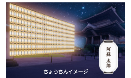
ちょうちんイメージ