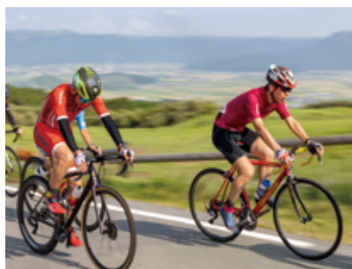
▲市街を見下ろしながら駆けあがる

9月10日、阿蘇いこいの村跡地から草千里駐車場までをランニングや自転車で駆けあがる「阿蘇パノラマラインヒルクライム」が開催されました。