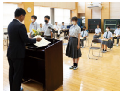
▲賞状と記念品が手渡された

8月31日、阿蘇中でいじめ防止標語の表彰式が開かれ、入選した10人に賞状と記念品が渡されました。阿蘇ロータリークラブが、阿蘇中の生徒340人を対象に、人権やいじめ防止についての標語を募集。最優秀作金賞に選ばれた標語は阿蘇警察署に掲示されます。