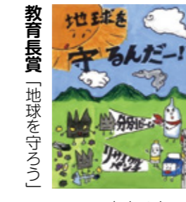
教育長賞「地球を守る」