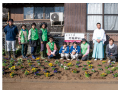
▲阿蘇神社の駐車場横の花壇を整備

同会が子育て世帯を支援する活動の一環として続けているもので、5組の利用者と同会のメンバー4人が参加。子育てや同会の活動に関する話をしながら手作りのだんごを楽しみました。2歳