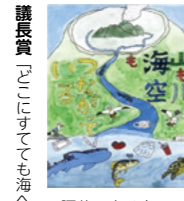
議長賞「でも海へ行く」