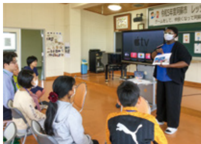
▲ALTと英語で話す児童

10月14日、市教育委員会主催の英語体験活動「レッツ・トライ・イングリッシュ」が市教育支援センターで開催され、小学校5・6年生20人が参加しました。