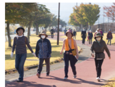
▲周回コースを歩く参加者ら

11月1日、阿蘇農村公園あびかでシルバースポーツ大会が開催されました。高齢者の健康維持のため市が主催し、市内から148人が参加。1周1,260メートルのコースを1時間それぞれのペースで周回しました。