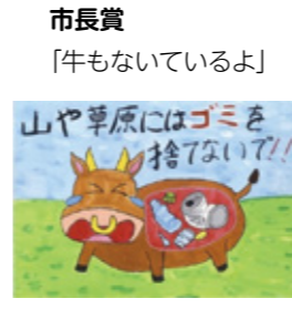
市長賞 「牛もいないよ」