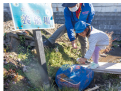
▲ホタルの幼虫を放流する園児

11月8日、北黒川のホタル繁殖場で、碧水ホタルの里のメンバー8人とYMCA黒川保育園の園児20人がホタルの幼虫を放流しました。