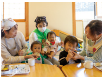
▲いきなりだんごに舌鼓

11月7日、阿蘇市一の宮町更生保護女性会が一の宮子育て支援センターで利用者といきなりだんごを作りました。