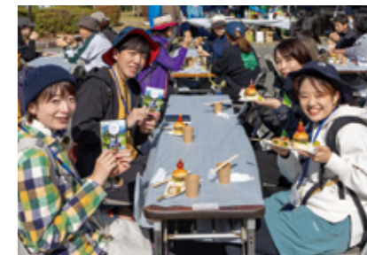
▲グルメを楽しむ参加者

10月29日、阿蘇の食や文化・歴史、自然を歩きながら体感するイベント「ONSEN・ガストロノミーウォーキング」が開催され、県内外から300人が参加しました。内牧温泉周辺の約7キロのウォーキングコースに5カ所設けられたガストロノミーポイントでは阿蘇の特産グルメやお酒を提供。参加者は阿蘇の秋を五感で楽しみました。