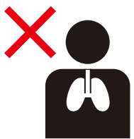
呼吸系統(肺)疾病患者