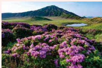
ミヤマキリシマ賞「早朝の草千里」

長寿ヶ丘公園では、シーズンになると一面に1万株のつつじが咲き誇ります。 ※熊本地震の影響により見学エリアを一部規制中