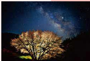
審査員特別賞「独り舞台」

阿蘇神社参道や明行寺をはじめとする阿蘇市一円で桜が楽しめます。阿蘇神社参道では、美しくライトアップされます。