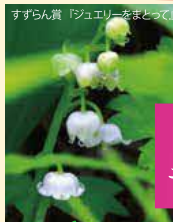
すずらん賞「シュエーをまどって」