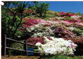
つつじ賞「つつじ咲く長寿ヶ丘」

はな阿蘇美のバラドームとガーデンには、750種4,000株のバラが咲き誇ります。併設されたカフェやレストランでは、期間限定の特別メニューも登場します。