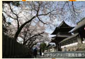
グランプリ「復興を願う」