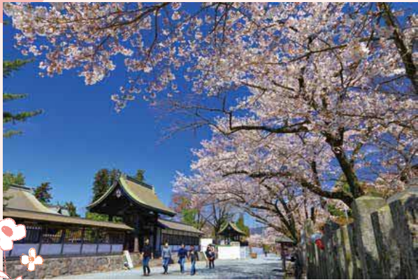
審査員特別賞「復興の桜」