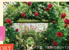
バラ賞「情熱の赤いバラ」

場所：ASO MILK FACTORY (はな阿蘇美) 見頃：4月下旬～6月上旬 10月中旬～11月中旬