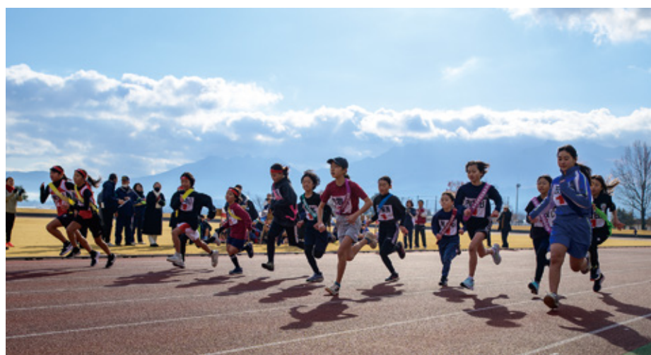
第21回阿蘇市民地域対抗駅伝大会

12月7日、農村公園あぴかで、第21回阿蘇市民地域対抗駅伝大会が開催されました。各地域の代表が熱戦を繰り広げました。結果は以下のとおりです。