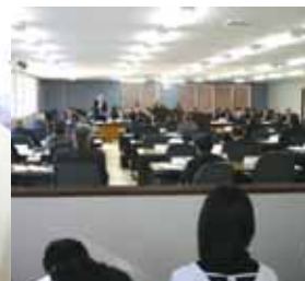
◀山田小6年の児童が熱心に議会を見学しているようす