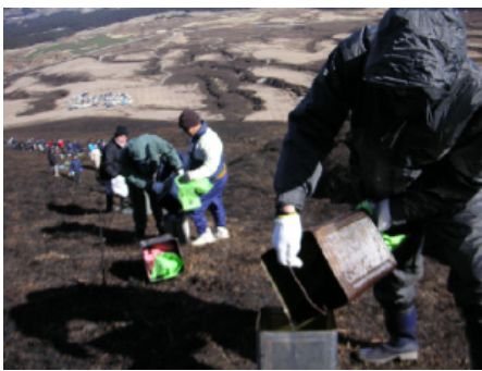
▲火文字設営のもよう。商工会や実行委員会など130人のボランティア作業員が、一日がかりで設営にあたりました。