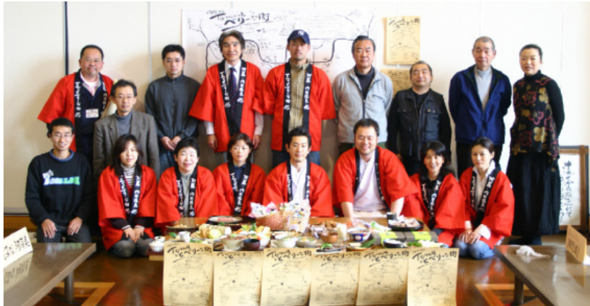
▲「T o m a っとベリーな街」実行委員会の皆さん

● 6月30日までこのような逸品が提供されます。ぜひ内牧温泉街へ立ち寄ってみてはいかがでしょうか。