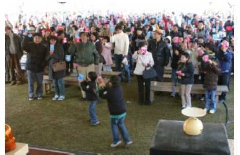
イベントショー(阿蘇っ子伝統芸能、阿蘇まるごとクイズ、コンサート、物産直売所など)。