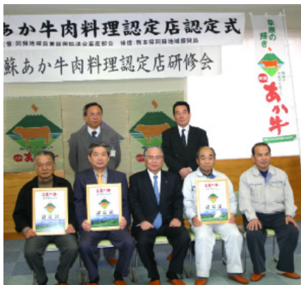
▲新しい加盟店店長と関係者の皆さん

阿蘇地域農業振興協議会畜産部会主催・熊本県後援の「阿蘇あか牛肉料理認定店」に新たに3店舗が加盟し、その認定式と全体の研修会が、3月15日、JA一の宮中央支所で開催されました。これで加盟店数は阿蘇郡内34店(阿蘇市内11店)になりました。「阿蘇あか牛肉料理認定店」とは、“阿蘇地域で誕生から肥育まで全期間飼養され、阿蘇産の飼料で育ち阿蘇で放牧された牛”を使用し、あか牛の普及活動に協力する店舗。「阿蘇へ来たらあか牛を食べて帰りたい」という意識が定着するように、調理工夫やもてなしを一層心がけたいと皆さん意欲的です。加盟店など詳しくは阿蘇地域振興局のホームページ(※)をご覧ください。