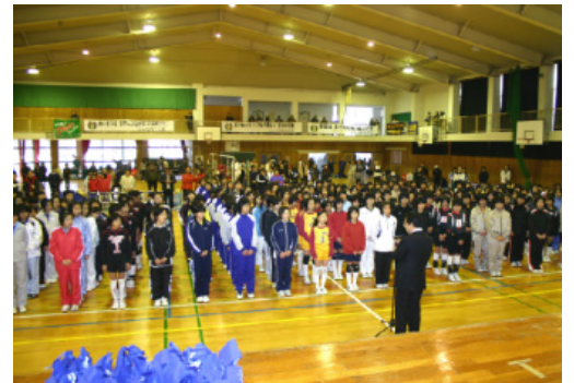
▲大阿蘇旗少女バレーボール大会開会式

春のスポーツシーズン到来！大会主催者など関係者のご尽力で数々の大会誘致が実現できています。第16回大阿蘇旗少女バレーボール大会（2/25阿蘇市バレーボール協会主催）では、県内外から小学生28チームが参加。第9回全九州大阿蘇旗争奪中学生女子バレーボール大会（3/10・11郡市バレーボール協会主催）は26チームが参加。全国から80校が参加した大阿蘇旗高校剣道練成大会（3/24・25実行委員会主催）では延べ2,000人が宿泊。第11回全国高校日本拳法選抜大会（3/29・30実行委員会主催）も全国からの選手が阿蘇市で戦い、涙と汗光る貴重な思い出を胸にしました。