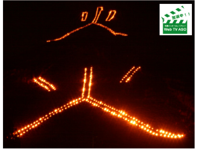
▲縦横350メートル、日本一の大きさを誇る火文字

市内で行われた催しは、阿蘇神社農耕神事の一つ火振り神事、総合センター特設ステージでのイベントショー、大火文字焼き、花火、神楽とそば手打ち体験交流(道の駅波野)などで、いずれも天候が心配されましたが、皆さんの協力で無事開催。特に、往生岳と本塚に数日前から設営されていた火文字は大人気で、山に火が灯り、やがてくっきり浮かび上がると、『炎』の文字にも見え、人々から歓声が上がりました。