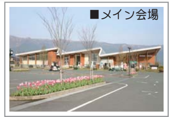
伝統芸能と特産市の会場となる「はな阿蘇美」