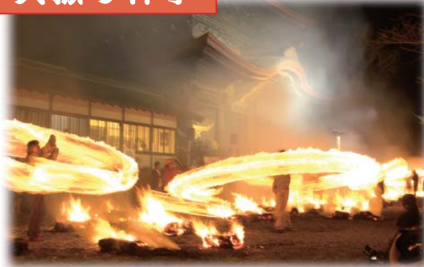
阿蘇神社の農耕神事（国指定無形民俗文化財）火振り神事