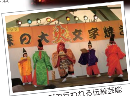
特設ステージで行われる伝統芸能