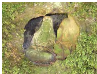
▲浄土寺に鎮座する「穴観音」