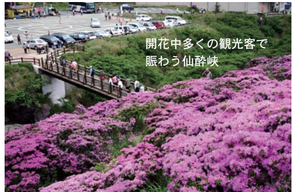
開花中多くの観光客で賑わう仙酔峡

※あまりの美しさに仙人も酔いしれたとされるミヤマキリシマの群生をぜひご覧ください。