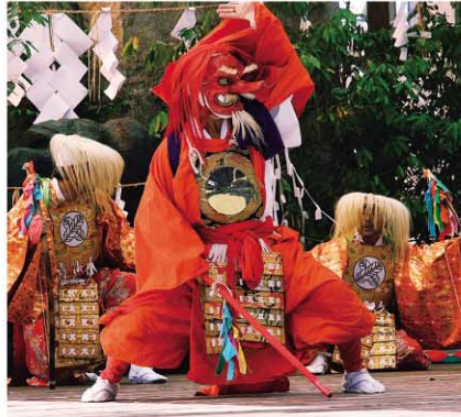
神楽フェスティバル