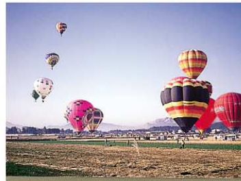
阿蘇バルーンフェスティバル