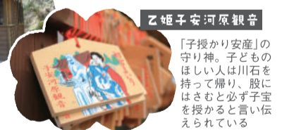
乙姫子安河原観音

境内の池から乳白色の水が湧くことからお乳や安産の神さまとして多くの人が参拝に訪れる