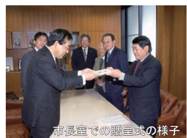
市長室での贈呈式の様子

なお、同クラブは、これまでも、阿蘇体育館など市内4ヶ所にソーラー時計を寄付されています。