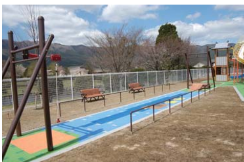
▲子どもたちに大人気のターザンロープ。 (杵島岳の谷渡り)