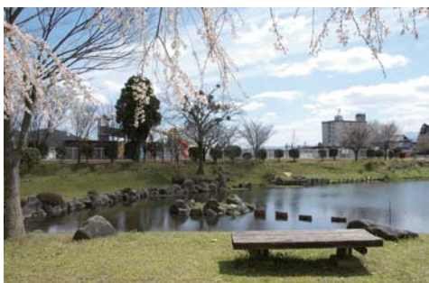
▲内牧中央公園と隣接。散歩も楽しめます。