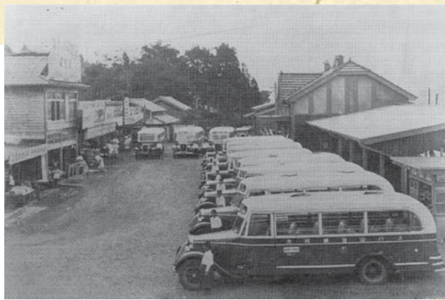
▲昭和7年頃の坊中駅前(阿蘇駅)