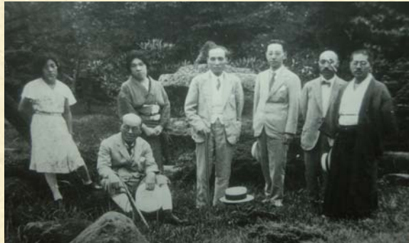
▲左から、6女の藤子氏、晶子氏、鉄幹氏、一番右端が後藤是山氏。

永田巳平氏が、与謝野鉄幹・晶子夫妻を迎えるにあたり、内牧城（現在の阿蘇体育館）の樹齢1000年の神木を手に入れつくられた客間がある。昭和7年、九州日日新聞社の後藤是山氏の案内で、与謝野鉄幹・晶子夫妻、6女の藤子さんが宿泊。客間は昭和7年以来手を加え当時のおもかげを残しています。与謝野夫妻は、この時の阿蘇滞在のうれしさを短歌にしている。