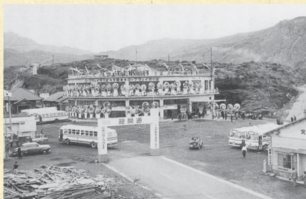
▲昭和33年4月、阿蘇山ロープウェイ開通式