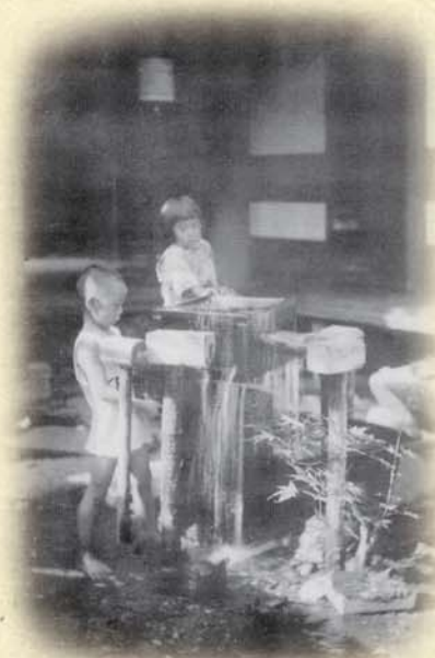
▲大正10年頃、内牧の民家に湧く温泉。

活火山阿蘇を恵みに、先代たちは「観光」をまちの産業として成長へ導き、その時代時代のニーズをとらえ、斬新なアイデアで遂行してこられました。国立公園化も全国をさきがけ行い、道路整備、鉄道整備においても先輩たちの先見性と情熱がにじんでいます。それらを土台に私たちは、今、情報網や交通網が日々発達する新時代を迎え、世界中へ阿蘇の名を響かせようと取り組んでいます。「故（ふる）きを温（たず）ね、新しきを知る」。先輩たちの積み重ねは、成功したもの、残念ながら失敗したものも全てが、よき参考書です。「まちを知る」うえでも先輩たちのメッセージを考えたいものです。