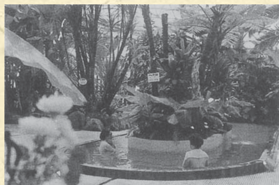
▲昭和36年 内牧にオープンした町営の「ジャングル温泉」。 真冬でも南国ムードが満喫できると人気を博しました。当時、まだめづらしかった温泉プールには、県内外から水泳選手が押しかけ、合宿ブームと話題になりました。

▶火口周辺の「阿蘇ハイライン」を周遊したマウントカー。昭和40年頃の写真。