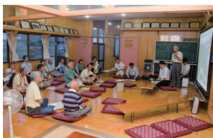
笹倉地区での説明会のようす

説明会に参加した笹倉地区の男性は、「災害後に滝室坂の危険性を危惧しており、トンネル工事の必要性を訴えてきた。トンネルの始点となる場所はどこになるのか」と観光施設がある道の駅波野「神楽苑」の集客への影響を心配していました。