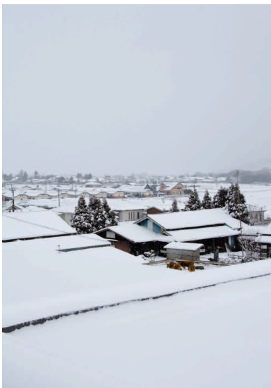
2月14日の阿蘇市役所付近のようす

費用のうち、燃料の一部助成を行っています。なお、この助成は3月20日までとなっています。各区長からの申請となりますので詳しくは総務課（☎22・3111）または区長にお問い合わせください。