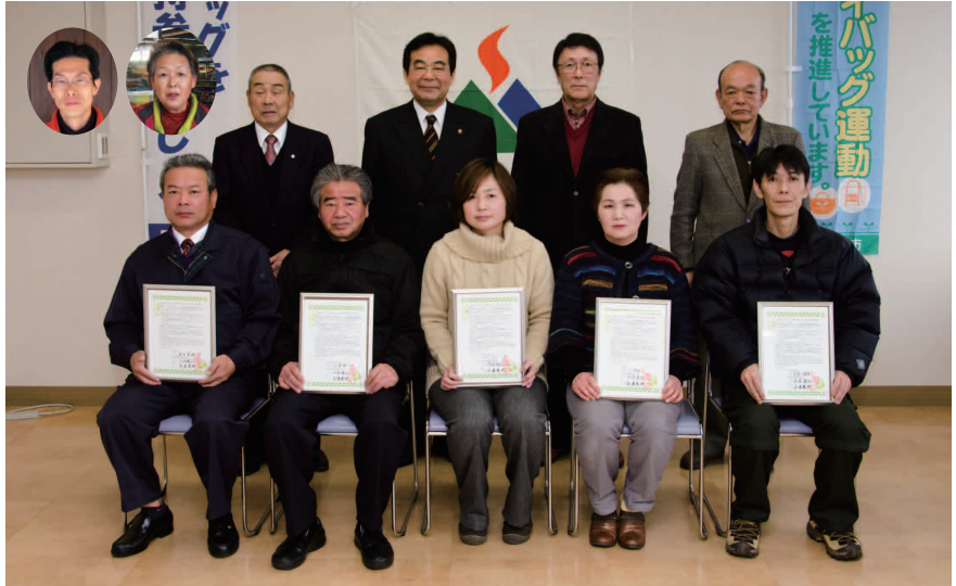
今回、新たに締結した事業所の皆さん

締結事業所では、マイバッグ利用を進めるため、ポイント付与やキャッシュバックなど特典を利用ください。