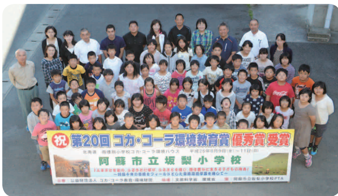
コカ・コーラ環境教育賞優秀賞

終選考会」において、代表児童2名が四季を通じた草原学習についてプレゼンテーションを行い、見事「優秀賞」に輝きました。