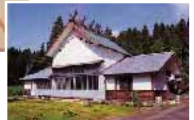
横堀岩戸神楽「郷土芸能伝承館」

波野村の自然に関する情報提供の基地研修室をはじめ、阿蘇地方に生息する野鳥・野草・昆虫等のパネル展示やそれに関する解説書や文献、神楽の衣装などの文化財も展示した博物館展示室・トイレ・シャワー室・駐車場あり。Tel: 24-2840