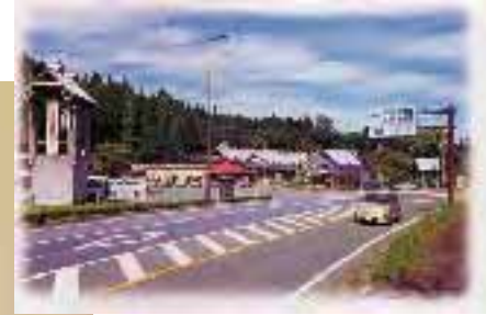
道の駅・波野「神楽苑」

神楽の舞台となるイベントデッキ、資料館、特産品直売所、そば処「岩戸開」などがある。Tel: 24-2331