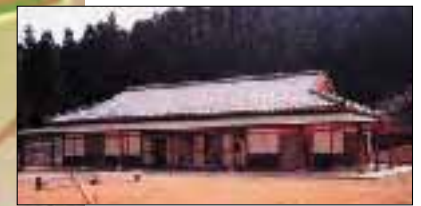
波野村ウォーキングセンター

小地野小学校を再利用した宿泊・研修施設。これからの時期さまざまな団体が賑わう。体育館・大広間・プール・浴室・コインランドリーなどがある。Tel: 23-0555