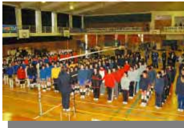
▲一の宮中学校体育館で行われた開会式のもよう

この日は、大変冷え込み、特に天草から来た小学生はカチンコチン。しかし、試合が始まると元気に飛び回り、全員よくがんばりました。