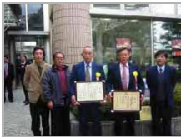
▲中部アスパラ部会のみなさん