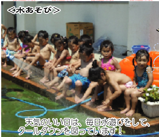
天気の良い日は、毎日水遊びをして、クールダウンを図っています！