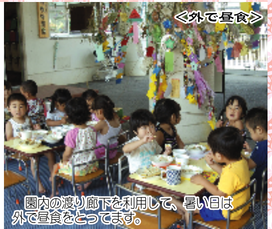
園内の渡り廊下を利用して、暑い日は外で昼食をとっています。