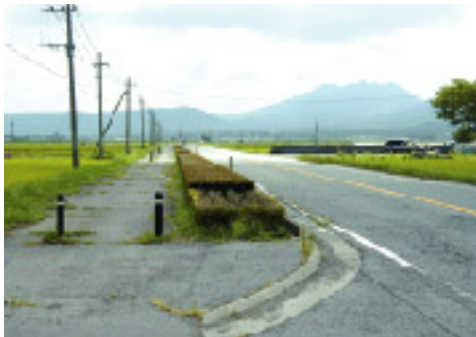
▲黒川第一汚水幹線工事が始まる国道212号。下水道管の路線は浜川地区、成川地区を通り国道212号（歩道部分）から黒川地区へとつながります。

平成20年度までに、78ha（北黒川、元黒川地区の一部、坊中地区の一部、黒川千丁地区の一部、内牧地区の一部、三久保地区の一部、狩尾地区の一部、浜川地区、成川地区）を整備します。その後の整備については、坊中地区を中心に東西へ拡張していく計画です。