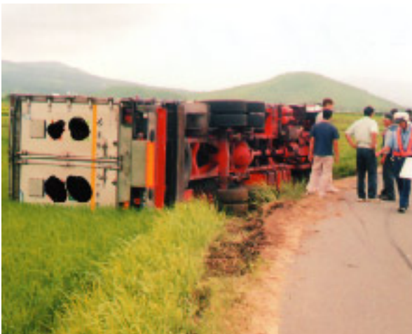
▲あびか～道尻の農免道路での事故。 農作物等にも被害が…