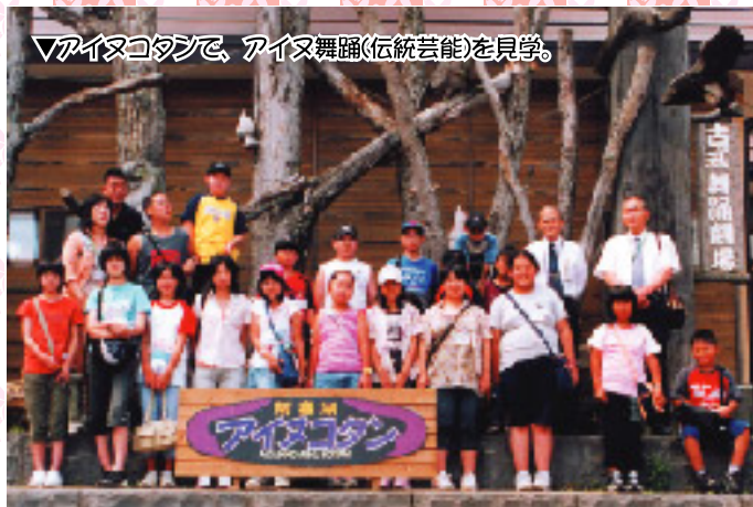
▽アイヌコタンで、アイヌ舞踊(伝統芸能)を見学。