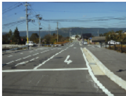
◀ 3月に開通した「化粧原竹の内線」

【消防費】 火災や台風などの災害発生時の防災活動のために要した経費です。決算額は、4億8,360万円で、主な事業として、消火栓や積載車などの消防活動のための施設整備、阿蘇火山防災活動などの事業を行っています。