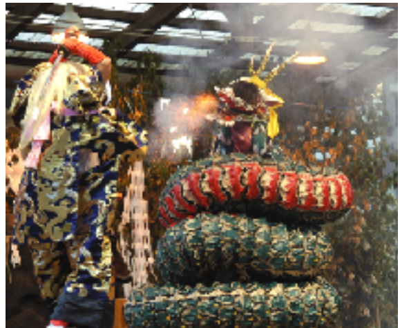
▲八雲払い【やくもばらい】（横堀岩戸神楽）

なお、神楽殿で4月から11月の第1日曜に行われている定期公演も11月6日が最終日ですので、ぜひ、おこしてください。