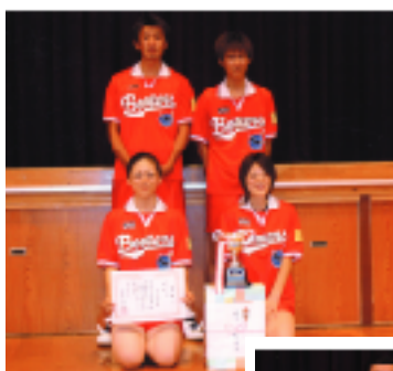
▲ソフトバレーの部 1位のボンバーズ1