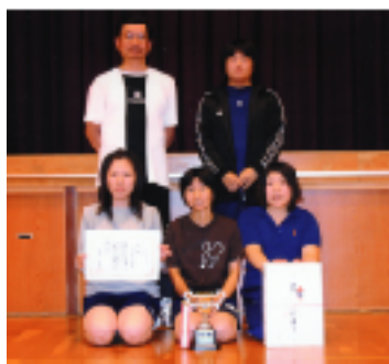
▶ エ1ミ ニ位 のバ レ エ レ ラ ズ の ク 部