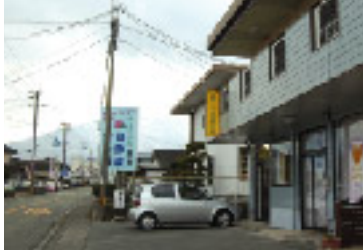
事務所連絡先：一の宮町宮地2005-8-203 (法務局阿蘇支局向い側2階) Tel：22-5223