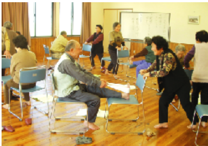
▲ももとふくらはぎのウラの筋肉を伸ばすストレッチです。 立位と座位、どちらでもできます。