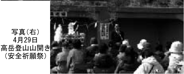
写真(右) 4月29日 高岳登山山開き(安全祈願祭)