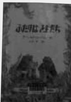
「ふたりはともだち」 作/アール・D・ベル 訳/三木卓 文化出版局

保育園の昼寝の時間に、おもちゃの取り合いをした、さとしとあきは、罰として押入れに入れられてしまいます。はじめは泣きべそをかいていたふたりでしたが、ねずみばあさんが現れて……。しつかりと手をつなぎ冒険に挑むふたりの姿にドキドキハラハラ。1974年の発行以来読み継がれている大ロングセラー