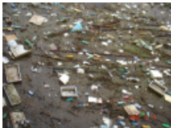
▲黒川第一ダムのゴミのようす