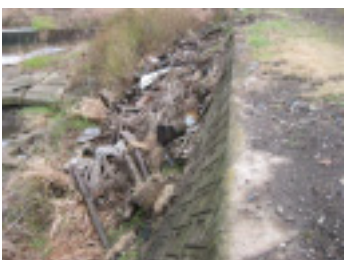
▲市の中央を流れる西岳川にもこんなにゴミが・・・