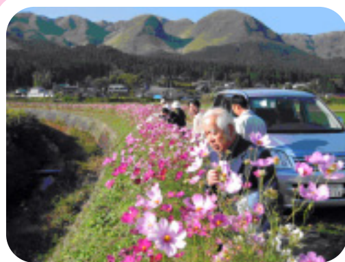
▲写真は昨年の審査のもよう