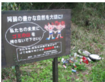
看板で警告しているにも関わらず、その横に捨てているゴミのようす。信じられません・・・。

廃棄物処理法の目的が、生活環境の保全及び公衆衛生の向上を図ることにありますので、阿蘇市など関係機関と連携し、各種、苦情、要望等を適切に処理することは勿論ですが、事件化措置を図ることを前提として厳しく対処することとしています。