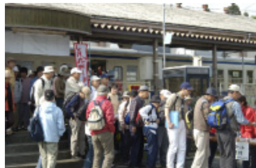
(写真上) JR宮地駅が主催し 毎年開催しているウォーキングツアー。参加者も320人と、年々人気を増えています。この日は、水基巡り・竹原牧場・古代の里美術館・仙酔峡などを楽しみました。

仙酔峡のつつじをはじめ、阿蘇山上のつつじ、波野のすずらん、はな阿蘇美のバラ、どれをとってもすばらしい素材をもった伝統ある祭りですので、これからも、工夫を重ね頑張っていきたいと思えます。