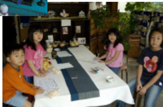
節句展に遊びに来ている子どもたち