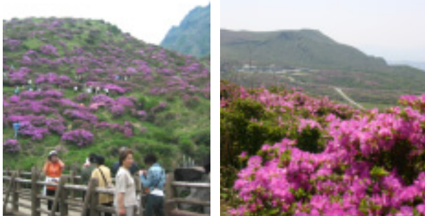
ミヤマキリシマ開花期間中、 仙酔峡7万人(左)、阿蘇山上30万人(右)の人出に。

初夏の花々とイベントを結びつけた「阿蘇の花の祭典」が、ゴールデンウィークから6月初旬まで開催されました。＜第56回仙酔峡つつじ祭り・阿蘇山上つつじ祭り・波野すずらん祭り・はな阿蘇美バラ祭り＞を次々にリンクさせたのは初めての試みでしたが、どの会場もたくさんの人で賑わい、新緑とともに、阿蘇の美しさを大いにPRできました。