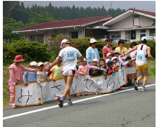
▲波野東部保育園では園児が自分たちで作った横断幕を掲げ応援しました。

なお、大会当日は、波野中学校陸上部、阿蘇高校、清峰高校の生徒や地域の方々が選手の荷物の管理や運搬にボランティアで協力いただきました。