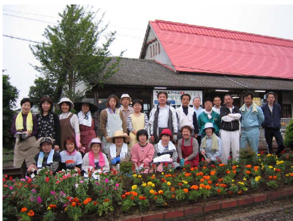
▲(上)内牧2区の清掃活動 (下)一の宮町商工会