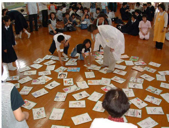
▲カルタ大会のようす

歯の衛生週間にちなみ、阿蘇地域歯科保健連絡推進協議会主催の「第11回阿蘇の歯まつり in あそし」が6月3日の宮就業改善センターで開催されました。