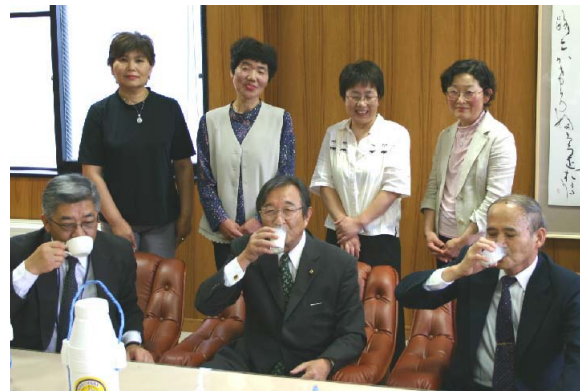
▲「冷たい牛乳は本当に喉の渇きが潤います」と喜ぶ収入役(右端)。

6月13日、阿蘇市役所に訪問し牛乳をプレゼント。収入役らが早速コップに牛乳を注ぎ飲み干しました。「牛乳は栄養も豊富、多くの方に飲んでいただければうれしい」と部員。阿蘇市でがんばる酪農家の皆さんにご協力お願いします。