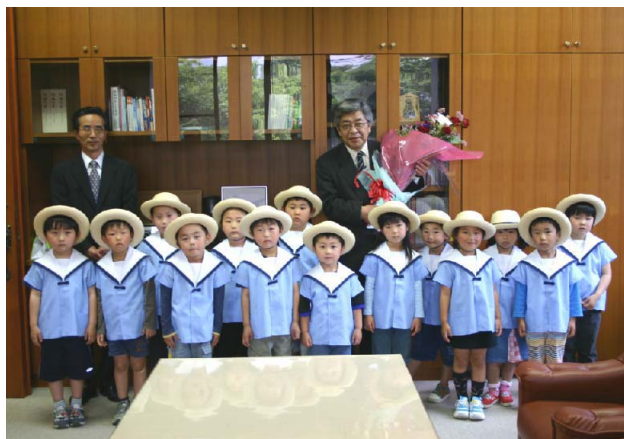
▲可愛いお客さんからの可愛いプレゼントに総務課長もにっこり。

6月6日、尾ヶ石保育園の園児が市役所に訪れ、家から摘んできた花々を届けました。このほか、阿蘇広域行政事務組合消防本部に永草保育園が、家入外科に赤水保育園が感謝の花束を届けたそうです。