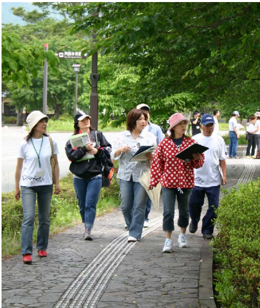
▲内牧を散策しながら勉強中