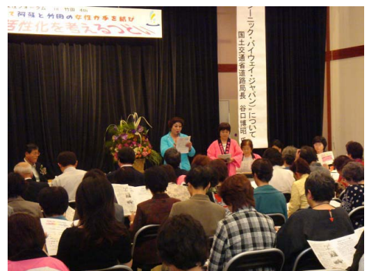
▲竹田市で開催されたフォーラムのようす

中九州横断道路は全長約120キロで平成6年に計画路線に指定され、現在大分県内の13キロを工事中ですが熊本県側は未着工です。