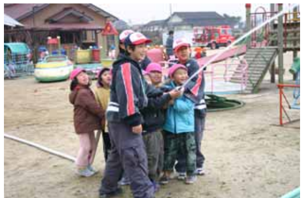
▲ 消防訓練をしている園児たち

冬は火災が発生しやすい時期です。火の取り扱いには十分注意しましょう！12月25日には、りんどう保育園で、中通小学校少年消防クラブと園児たちの交流会が行われました。阿蘇市消防団第5分団や阿蘇広域消防本部に協力してもらい、年2回夏と冬に交流を行っているこの交流会で園児たちは、同クラブとともに手押しポンプを使って標的落としをしたり、救急車や消防車に乗ったりして、楽しみながらも消防について学ぶなど、火事に対する消防意識を高めていました。