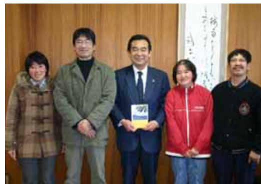
▲12月4日、市役所に訪問し、「色々な形で福祉の現状・現場を伝えていきたい」と、市長に本を手渡しました。

※作業所「夢屋」は、障害児・者と共にパンづくりや販売をし、障害者の社会参加を図る作業所で、昨年10月から市から委託を受けて地域生活支援事業も開始しています。