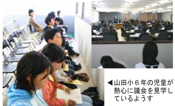
◀山田小6年の児童が熱心に議会を見学しているようす

12月11日、宮地小学校6年生57人及び山田小学校6年生14人が社会科学習の一環で12月の定例議会を見学しました。児童たちは傍聴席に座り審議のようすをノートに書いたり、絵にするなど熱心に聴き入っていました。児童たちは、「緊張した。議員さんのやりとりがすごかった。」など終始驚いていたようす。傍聴後一気に緊張感から開放されほっとしたようすでした。今回の見学を終えて、後日児童たちは議会のようすを感想文等にまとめました。