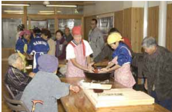
▲ 12月18日、なみの高原やすらぎ交流館で、自分たちで栽培したそばで麺打ちを体験。「かけそば」にして、デイサービスのお年寄りたちに振る舞いました。