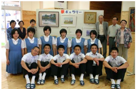
▲出品した方々と3年生の皆さん

7月19日のオープンスクール(学校公開日)では、出品した方たちが中学校に招待され、生徒たちとともに給食を食べながら楽しいひとときを過ごしました。