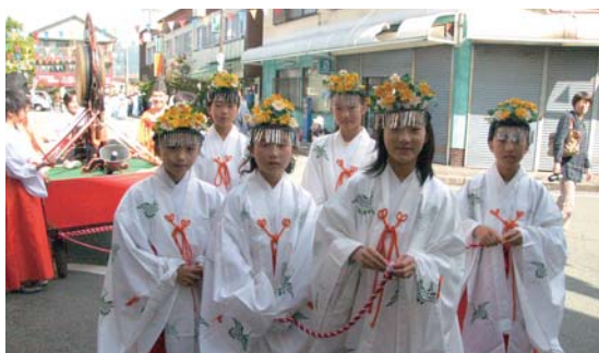
▲昨年、巫女の舞を披露した皆さん