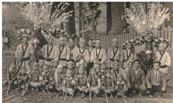
▲昭和23年9月28日、馬場八幡宮秋季大祭下町組の飾り馬奉納

懐かしいお顔や、風景、暮らしぶりに出会えます。そしてあなたご自身に出会えるかも知れません。