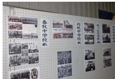
▲体育館に展示された写真展。一年ごとに展示され卒業生を喜ばせました。

「50年のあゆみ」を刻むにふさわしい今回の創立50周年記念事業でしたが、その取り組みは、平成19年度からスタートし、生徒は点画などの大作の製作に挑み、保護者は記念誌やDVD等の製作を、また、教員は総括して努め、その成果は、卒業生、また未来の生徒たちへの力強いエールとなりました。