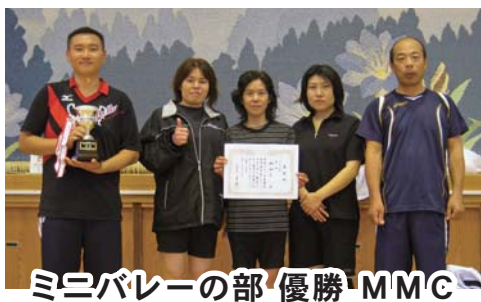
ミニバレーの部 優勝 MMC