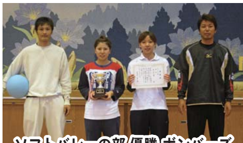
ソフトバレーの部 優勝 ポンパーズ