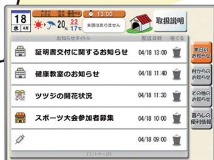
お知らせ配信イメージ

見たいお知らせだけ 好きな時間にタッチして 見られるから 帰りが遅い私も大助かり！