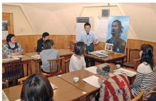
▲「阿蘇市へ呼ぶ会」サポーター会議の様子 ラブレターの収集やPRをつとめます

問い合わせ先 「阿蘇市へ呼ぶ会」事務局(阿蘇インフォメーションセンター内) ☎32-1960